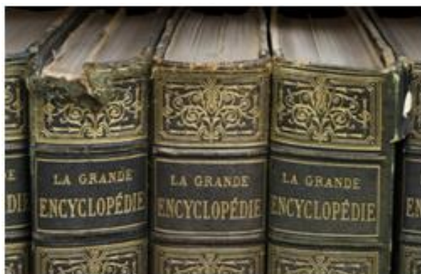
„Wielka Encyklopedia Francuska”